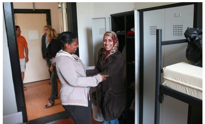
Eerste asielzoekers in De Kruisberg

Onlangs heeft het COA opnieuw een verzoek ingediend, ditmaal om het aantal opvangplekken in De Kruisberg te verhogen naar 800 asielzoekers en de duur van de opvang van 3 naar 5 jaar. Een aantal van 800 asielzoekers kan niet binnen de bestaande bebouwing worden opgevangen. Behalve de vraag of asielzoekers op deze manier nog op een humane wijze zouden worden opgevangen vraagt dit om een enorm aanpassingsvermogen van de buurt. Tot nu toe is de buurt begripvol en genuanceerd met de opvang van asielzoekers en de tijdelijke uitbreiding omgegaan. De fractie van GroenLinks heeft waardering voor de buurtbewoners en alle vrijwilligers die de vluchtelingen een warm hart toedragen.